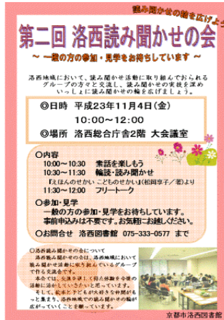
第2回“洛西読み聞かせの会”案内ポスター