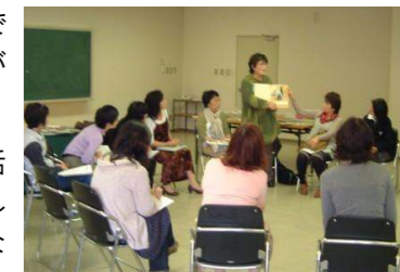
第2回“洛西読み聞かせの会” (平成23年11月4日) おすすめ絵本 ほか