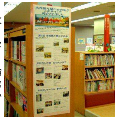
洛西ニュータウン情報サイトで紹介されたことを図書館内で“紹介”