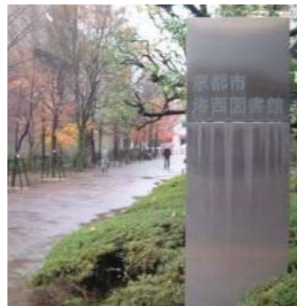
洛西図書館前通り