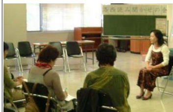
第2回“洛西読み聞かせの会” (平成23年11月4日) 素話を楽しもう