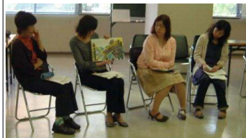
第2回“洛西読み聞かせの会” (平成23年11月4日) 輪読・読み聞かせ

実際に輪読してみると、一人で読むよりもどんどん読み進められて、しかも心に残っていきます。楽しく和やかに、笑いも交えながら、読み聞かせの原点に触れることができました。