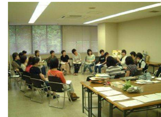
第1回“洛西読み聞かせの会”(平成23年7月7日)