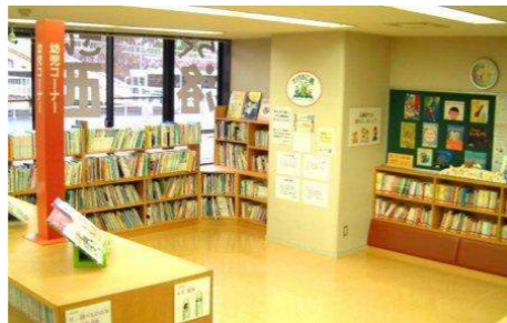
絵本コーナー“たけのこ島”

また、この“洛西図書館だより”準備号について、ご意見ご感想などございましたら、洛西図書館までお寄せください。皆様とともによりよい情報誌にしていきたいと考えていますので、よろしく願います。