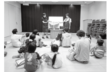
夏休みおたのしみ会