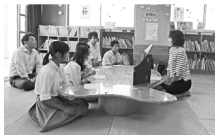
指導員さんからアドバイスを受けて

安祥寺中学校文化図書委員の生徒たちは、学校図書館運営支援員や山科図書館の司書からの「小学生に読んであげるのではなく、一緒に楽しむことが大事。みんなの楽しいという気持ちが伝わって、小学生も楽しいと感じるのですよ。」というアドバイスを受け、読み聞かせの練習や準備を行いました。