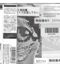
CD『シェイクスピアの音楽』 フィリップ・ピケット ユニバーサルミュージック

本場グローブ座が贈るシェイクスピアの劇中歌、舞曲、バラッドの数々を集めたアルバムです。(醍醐中央図書館所蔵)