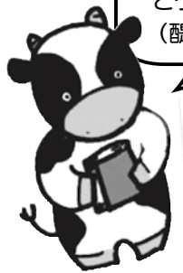
醍醐中央図書館 マスコットキャラクター よもう君です。

みんなで本をよもう！当館は、平成9年4月29日に開館！ 今年で18年目です。 地下鉄醍醐駅の4階なので、アクセス抜群です。 どうぞお越しください。 (醍醐駅下車。1番出口から出てパセオダイゴロー西館4階へ)