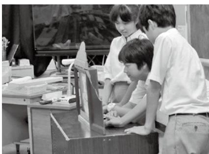
最初は少し緊張気味の生徒たち

平成26年6月27日、2～3名ずつの組になった安祥寺中学校の生徒たちは、西野小学校の1年生・2年生の児童に対して、紙芝居や大型絵本の読み聞かせを行いました。