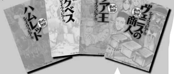
『まんがで読破』シリーズ 『ハムレット』『マクベス』『リア王』『ヴェニスの商人』 バラエティ・アートワークス/企画・漫画 イーストプレス

『シェイクスピアって おもしろい!』 シリーズ 1~5 ロイス・バーデット/著 鈴木扶佐子/訳 アートデイズ