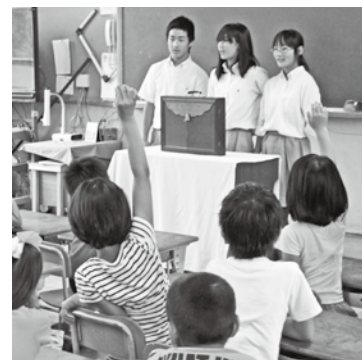
参加型の紙芝居では、児童から色々な答えが飛出し、教室全体が楽しい空気に