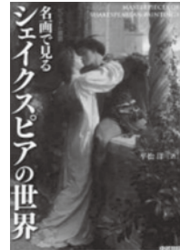
『名画で見るシェイクスピアの世界』 平松洋/著 KADOKAWA ビジュアル選書