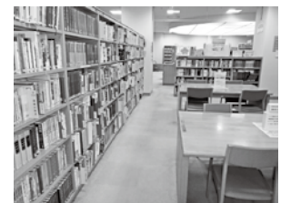
醍醐・伏見地域の書籍コーナー