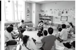
絵本と紙芝居の会