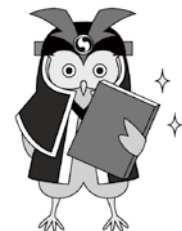
山科図書館 マスコットキャラクター ぶっくろう