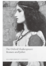
『Romeo and Juliet』 Oxford University

シェイクスピアの言葉に直接触れたいと思われる方は、洋書に挑戦してみたいかがでしょうか？ 京都市図書館では20編のシェイクスピアの原書を所蔵しています。