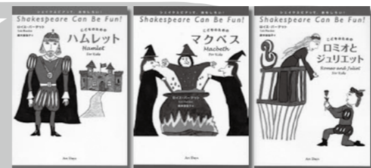
『こどものためのハムレット』『こどものためのマクベス』『こどものためのロミオとジュリエット』

『シェイクスピアって おもしろい!』 シリーズ 1~5 ロイス・バーデット/著 鈴木扶佐子/訳 アートデイズ