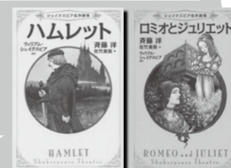
『ハムレット』『ロミオとジュリエット』

『シェイクスピア 名作劇場』 シリーズ 1~以後続刊 斎藤洋/文 佐竹美保/絵 あすなろ書房