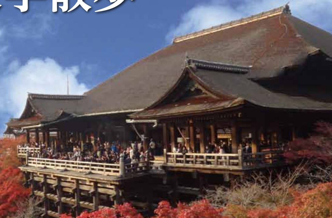
『徒然草』(第47段)の舞台 清水寺 本堂