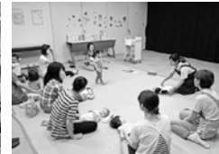
ベビーマッサージ