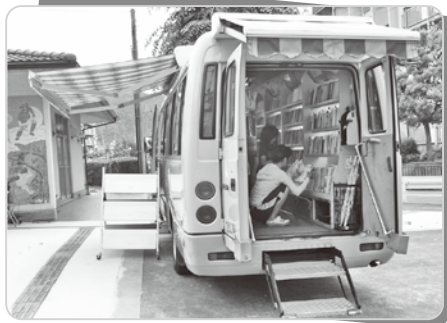
「いわたの森市営住宅集会所前」 平成25年1月以降の醍醐図書館臨時休館に伴い3月から臨時に巡回しています。

いつもインターネットで予約して、色んなところから本を取り寄せていただいて、とても助かっています。娘も本が大好きで1か月に1回心待ちにしています。