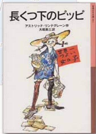
『長くつ下のピッピ』 アストリッド・リンドグレーン/作 大塚勇三/訳 岩波書店

作品の特徴として、『長くつ下のピッピ』のように、「おもいっきり楽しい空想をひろげ、子どもの望みや夢をのびのびとかなえる作品」をはじめとして、『やかまし村の子』