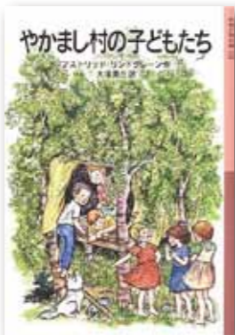
『やかまし村の子どもたち』 アストリッド・リンドグレーン/作 大塚勇三/訳 岩波書店