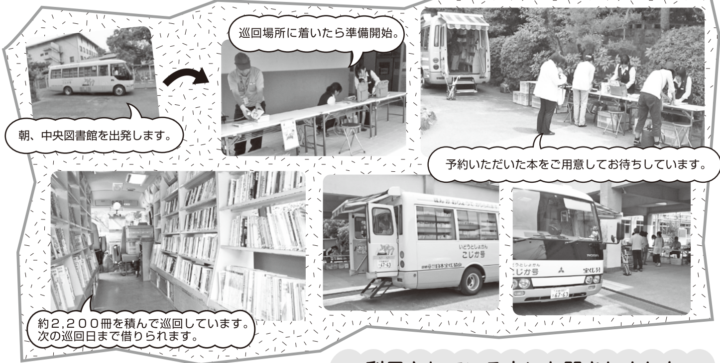
朝、中央図書館を出発します。

移動図書館は、場所を提供していただいている学校をはじめ地域の方々の協力のもと、人々に支えられ共に歩んできた図書館です。暑い日も寒い日も、一日に約3カ所、年間で約177日、待っていてくださる方々の所へ本をお届けします。その日の巡回コースに合わせてバスに積む本を変えるなど少ない資料でも良いサービスができるよう工夫しています。