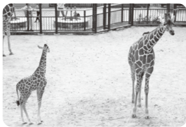
左 5月生まれの瓜生 右 姉の紫雲

～キリンの「孫の手」～ 『イルカのジャンプに夢をのせて』所収 国松 俊英 編 ポプラ社