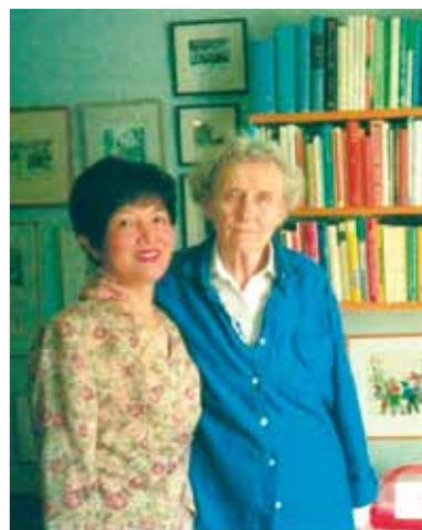
▲リンドグレーンとともに。(1994年)

スウェーデンの作家アストリッド・リンドグレーンは、世界じゅうの子どもたちが大好きな、『長くつ下のピッピ』（岩波書店・大塚勇三訳）の作者というだけでなく、次々と人々の心をうつ作品を発表しながらも、同時に社会のオピニオン・リーダーとして、原発反対、動物愛護、暴力禁止、人口問題などに取り組み、政府に物を言い、法律に影響を与えました。それでも独特のユーモアと温かさで、絶えずとびきりの人気を得ていました。