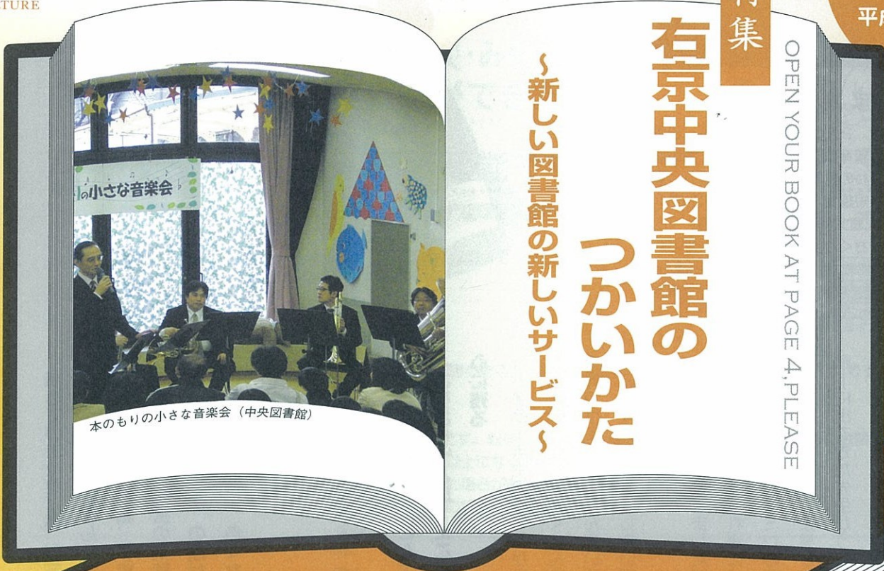
本のもりの小さな音楽会（中央図書館）