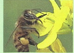
ミツバチの社会生活

昆虫、動物、植物、魚。陸海空この地球上の様々な生きものにスポットを当てています。その数およそ180！ 図鑑が動画になりました！